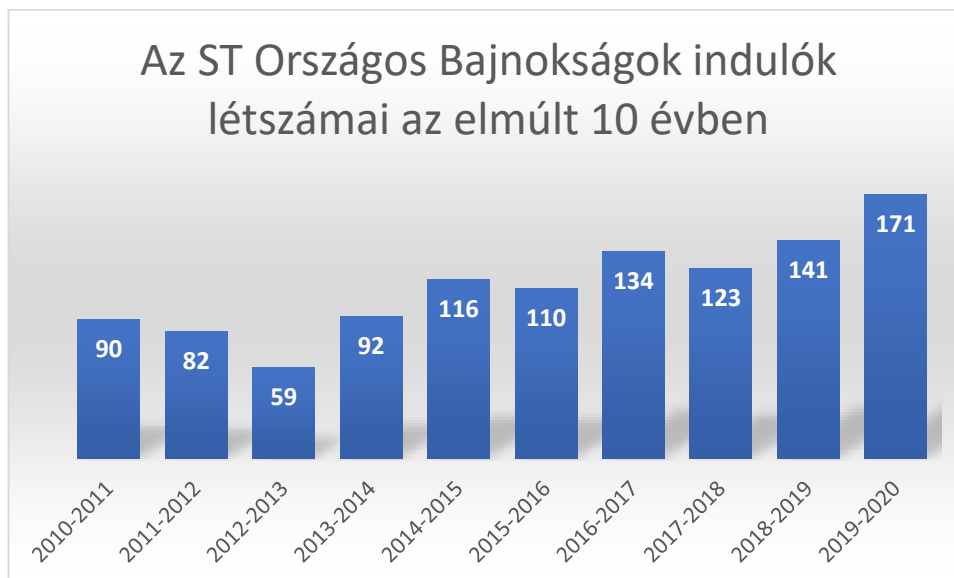
1. sz. táblázat

A short track bajnokságok indulói létszámának alakulását a 3. számú táblázat mutatja