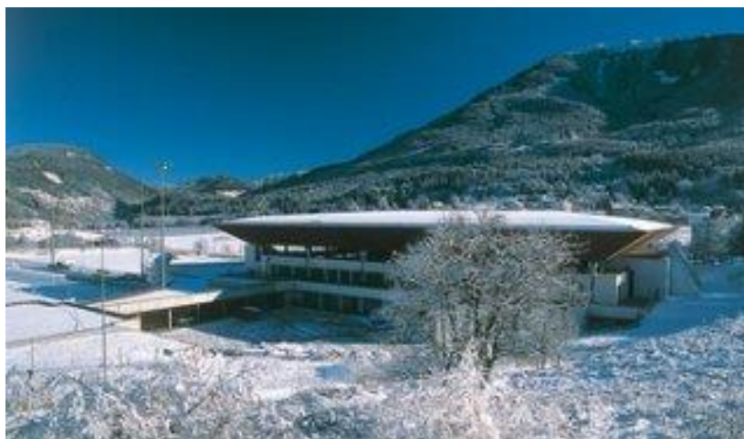
Baselga de Piné (Olaszország)

A versenyre a Danubia Series és a StarClass elnevezésű versenysorozatok legjobb 8-8 versenyzője kvalifikálhat, így korcsoportonként 16 induló van. Az idei versenyre a magyar csapat 14 kvalifikált versenyzőből és 2 edzőből álló delegációt küldött. A csapatból 8 versenyző térhetett haza éremmel vagy érmeikkel. Egyéniben és váltóversenyben egyaránt sikereket ért el a csapat. Legsikeresebb versenyzőnk a Lányoknál Kónya Zsófia 5 ezüstérmét szerzett Jászapáti Petra pedig 3 ezüstérem és egy aranyérem birtokosa lett. Fiú versenyzőink közül Liu Shaolin Sándor 4 aranyérmét, 1 ezüstérmét, testvére Liu Shaoang pedig 2 aranyérmét és 2 ezüstérmét szerzett. Az Európa legjobbjait felvonultató verseny évről évre egyre színvonalasabb, az edzők is nagy hangsúlyt fektetnek az Európa Kupára való felkészülésre. Mára elmondhatjuk a fiatalok számára a junior világbajnokság utáni második számú versennyé nőtte ki magát.